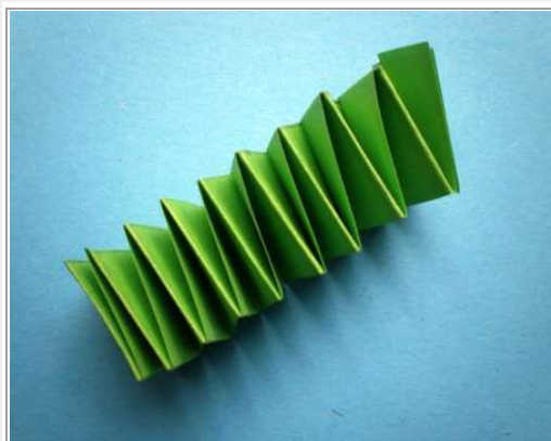
Stap 10 & 11