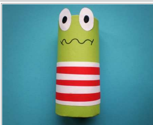
Stap 5 & 6