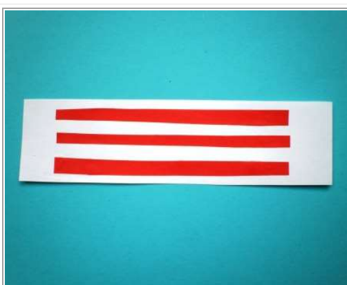
Stap 2 & 3